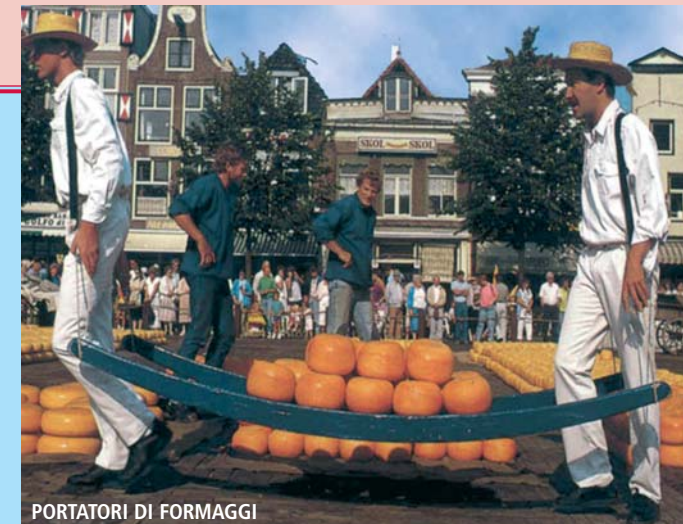
PORTATORI DI FORMAGGI