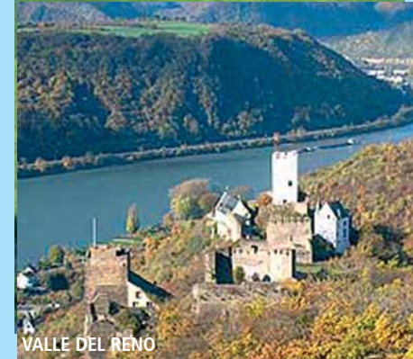
VALLE DEL RENO